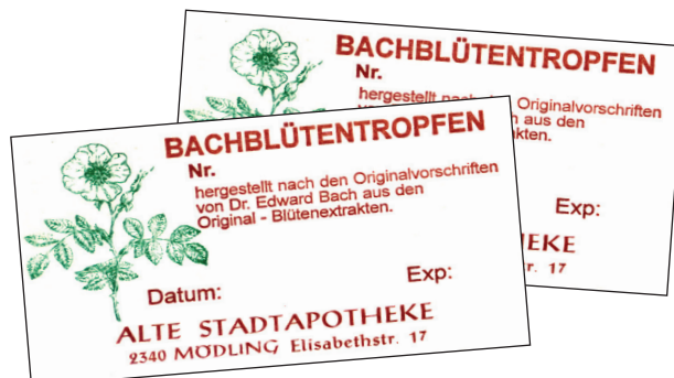
Muster in Originalgröße